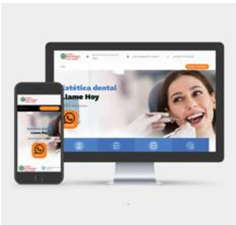
Sitio Web para Odontología Cozak

Elaboración de planes de Marketing Digital, con el fin de ejecutarlos principalmente en Google, Facebook e Instagram Ads. Creación de informes e